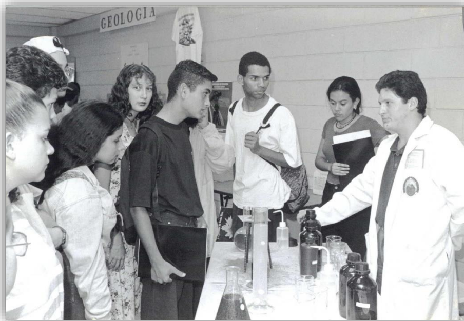
Feria Vocacional 29 y 30 de agosto de 1996. Fototeca Universidad de Costa Rica, Colección Semanario Universidad, en custodia en el Archivo Universitario.