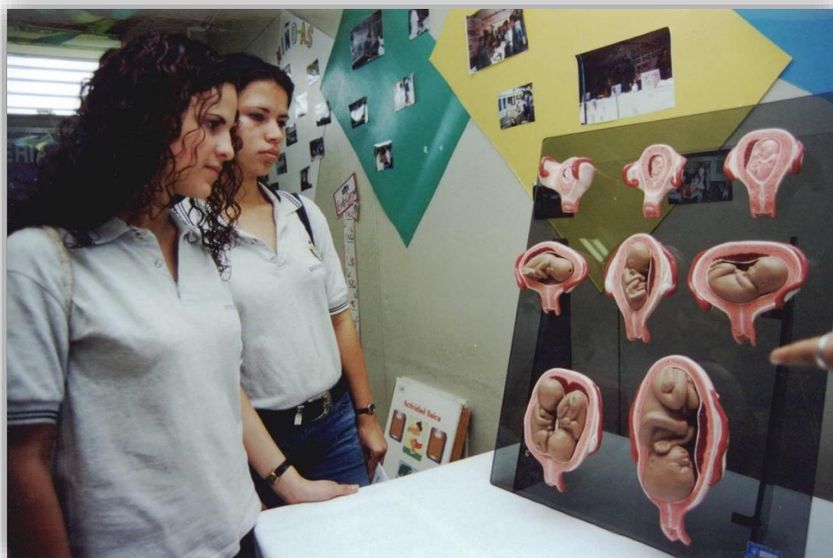
Feria Vocacional 2002.