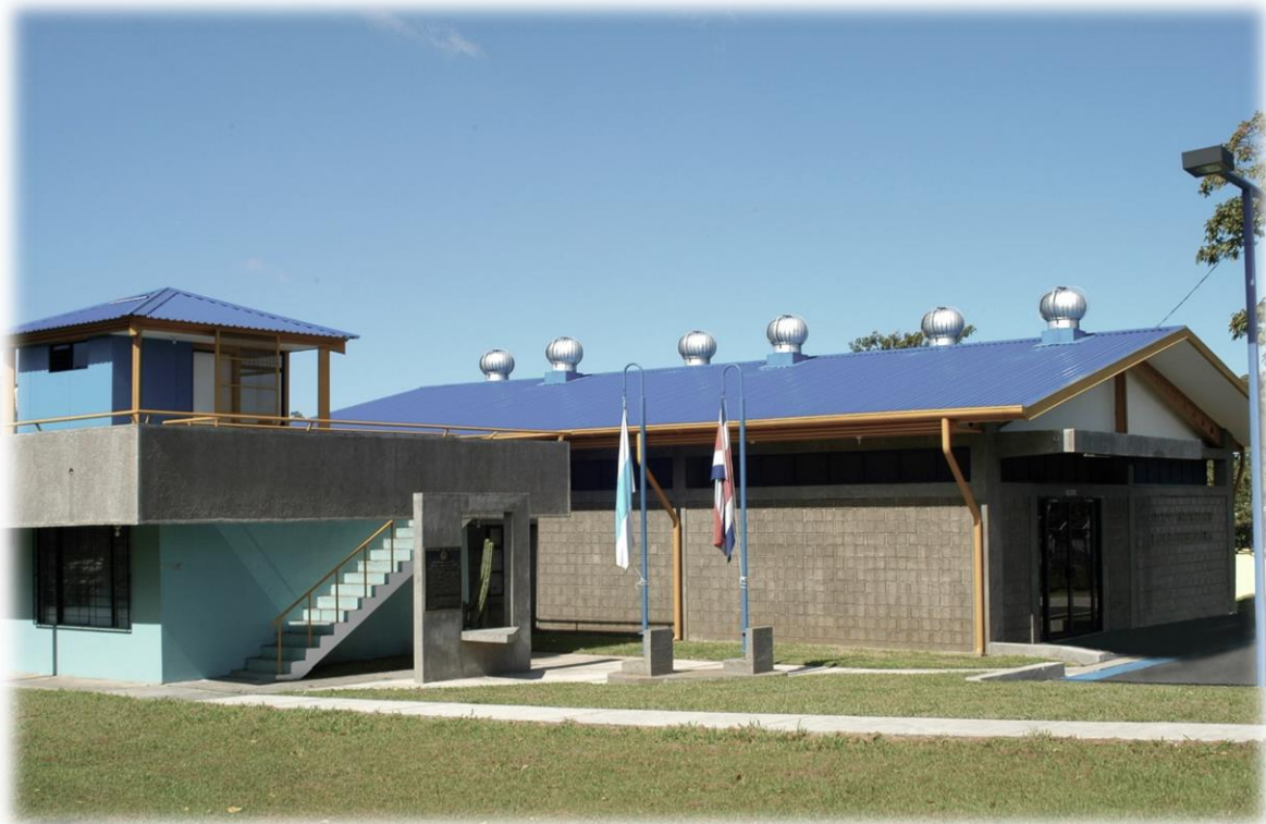
Archivo Universitario Rafael Obregón Loría, enero 2004. Fototeca Universidad de Costa Rica, en custodia en el Archivo Universitario.