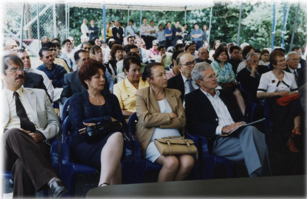
Inauguración del Archivo Universitario Rafael Obregón Loría. 5 de mayo de 2003. Fototeca Universidad de Costa Rica, en custodia en el Archivo Universitario.