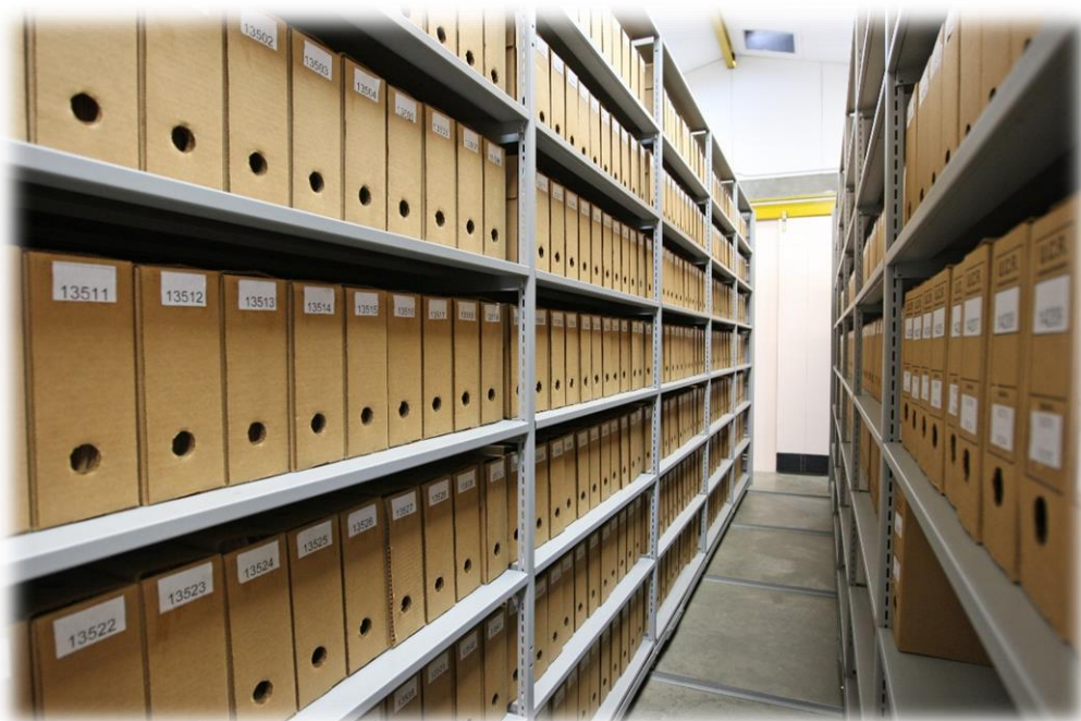
Depósitos documentales del Archivo Universitario Rafael Obregón Loría. Fototeca Universidad de Costa Rica, en custodia en el Archivo Universitario.