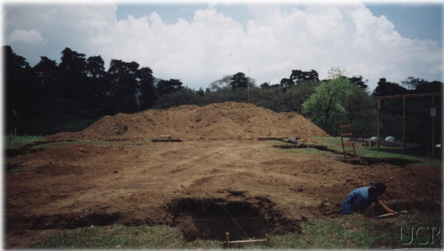
Construcción de las instalaciones del Archivo Universitario, s.f. Fototeca Universidad de Costa Rica, en custodia en el Archivo Universitario.